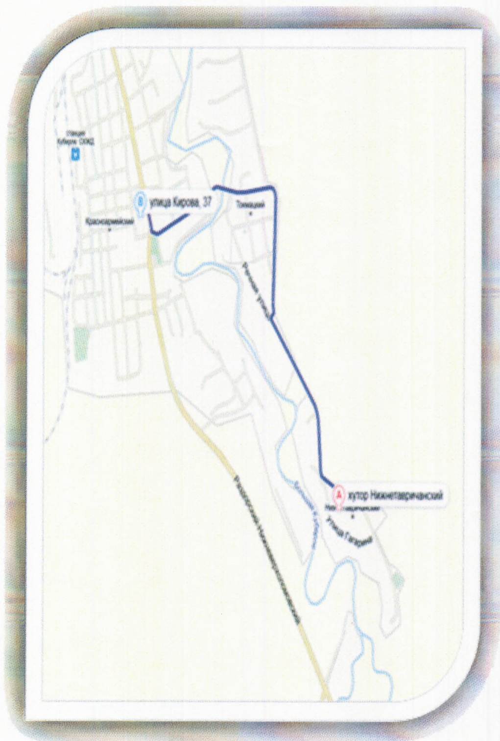
Схема движения школьного автобуса по маршруту МБОУ Красноармейская СОШ - х. Токмацкий – х. Нижнетавричанский